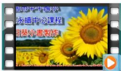
生態永續中心課程-向日葵小書製作影片