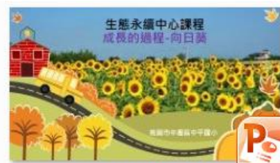
生態永續中心課程-向日葵成長過程繪本簡報