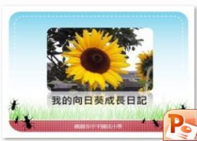
生態永續中心課程-我的向日葵成長日記簡報