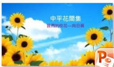
生態永續中心課程-中平花間集教學簡報

2. 目前依照「生態永續中心-百變葵花」課程總表，已設計完成 1-6 年級教案及學習單，讓老師進行教學活動，另剪輯了三部教學影片(生態永續中心課程-向日葵教學下課花路米影片、生態永續中心課程-向日葵小書製作影片、生態永續中心課程-落葉堆肥影片)；製作三份教學簡報檔(生態永續中心課程-中平花間集教學簡報、生態永續中心課程-我的向日葵成長日記簡報、生態永續中心課程-向日葵成長過程繪本簡報)提供老師更簡易方便的教學。