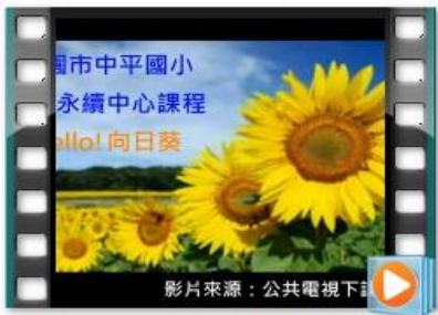
生態永續中心課程-向日葵教學下課花路米影片