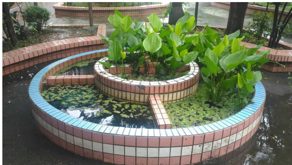
中庭生態池種植多樣水生植物