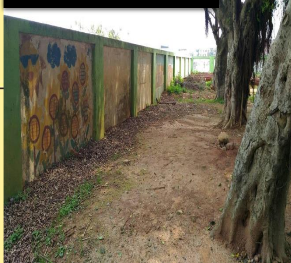
貧脊硬化校園死角