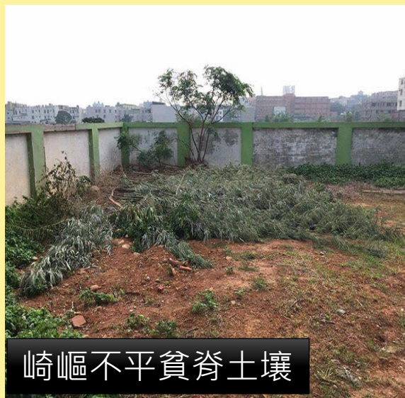
崎嶇不平貧脊土壤