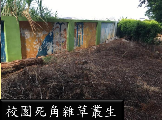
校園死角雜草叢生