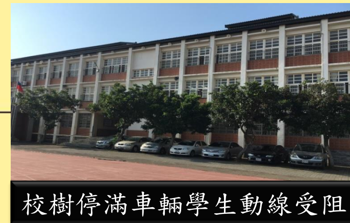
校樹停滿車輛學生動線受阻