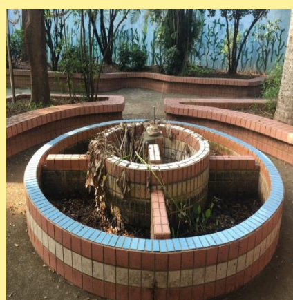
嚴重漏水生態池，蚊蠅溫床