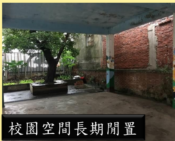
校園空間長期間置