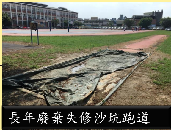
長年廢棄失修沙坑跑道