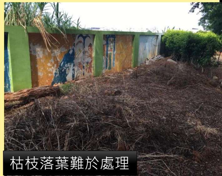
枯枝落葉難於處理