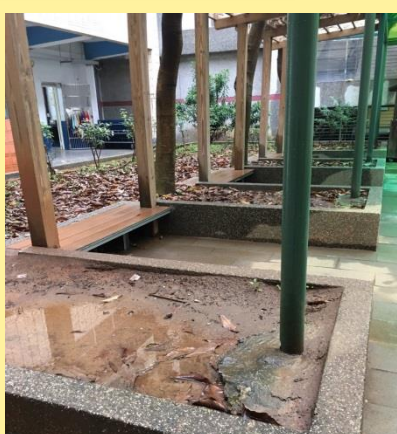
積水且土壤流失的花圃