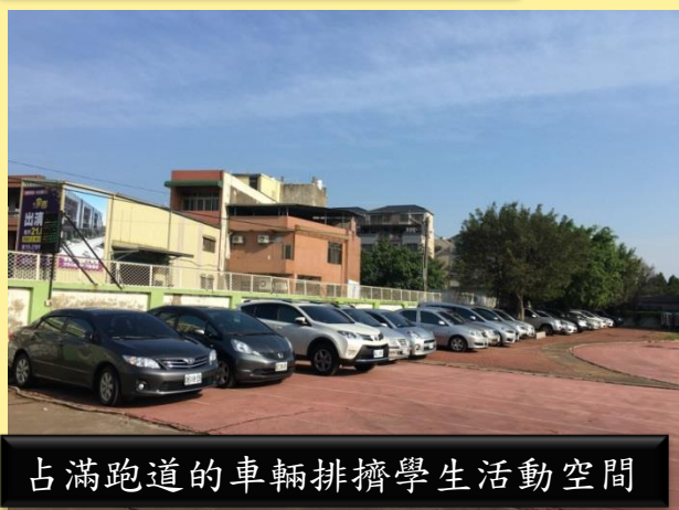
占滿跑道的車輛排擠學生活動空間