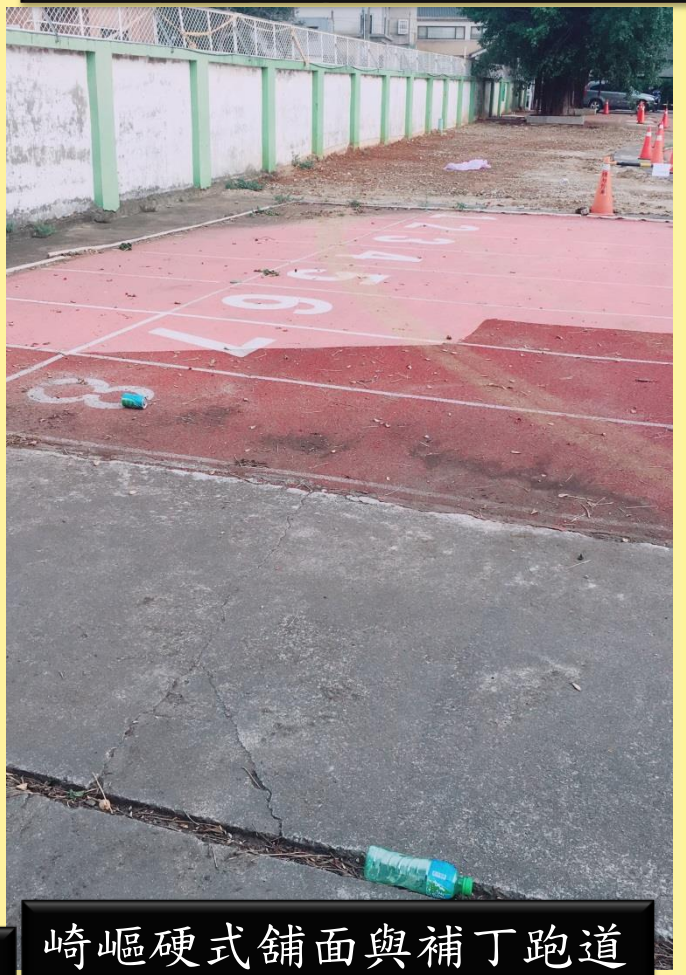
崎嶇硬式鋪面與補丁跑道