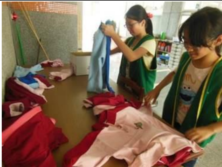
說明：環保小尖兵協助制服回收整理