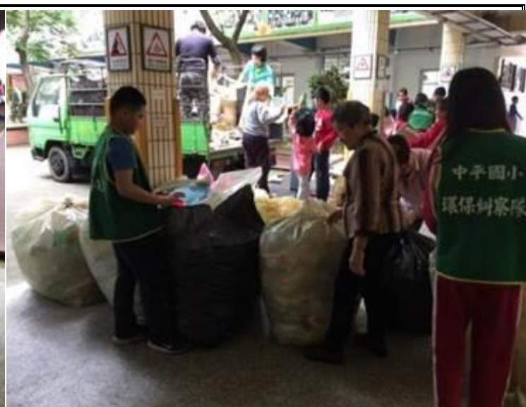
說明：環保小尖兵及志工協助回收事宜