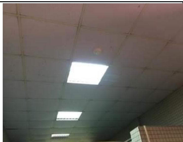
說明：廁所安裝紅外線感應式電燈