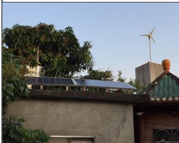
說明：太陽能與風力發電(節電)