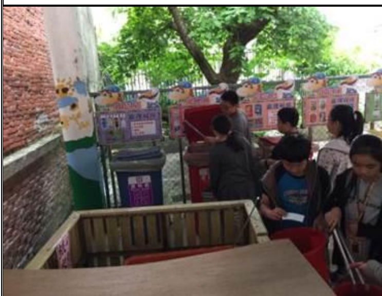
說明：由六年級學生負責布馬資收站