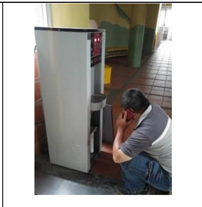
說明：定期檢測飲水機