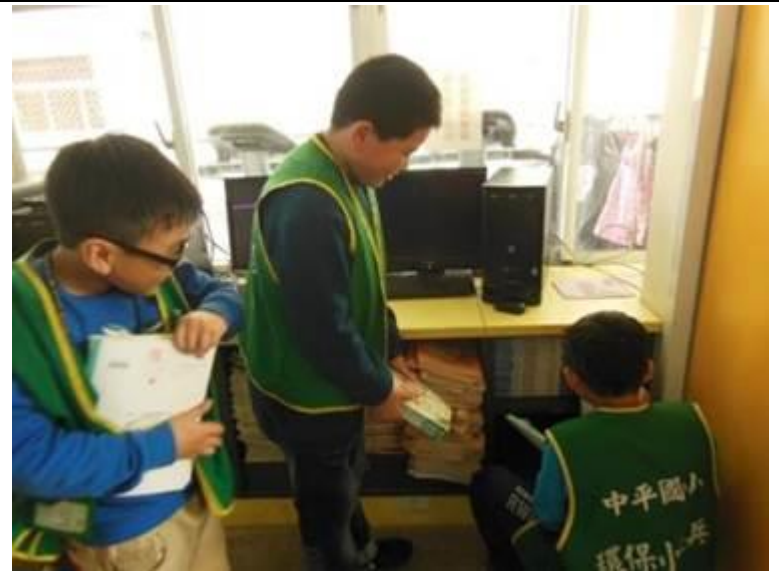
說明：環保小尖兵協助教科書回收整理