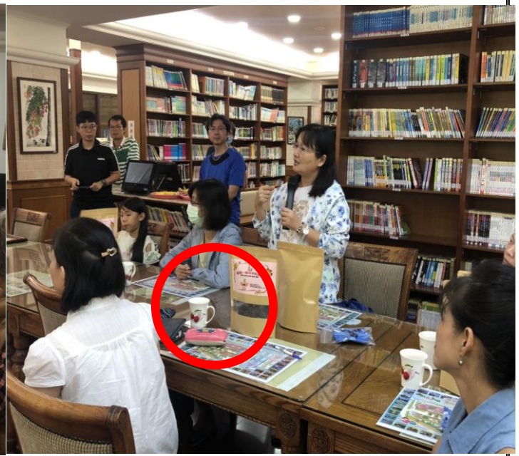
說明：外賓到校參訪均使用環保杯