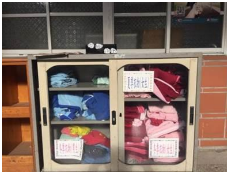
說明：回收二手制服擺放區