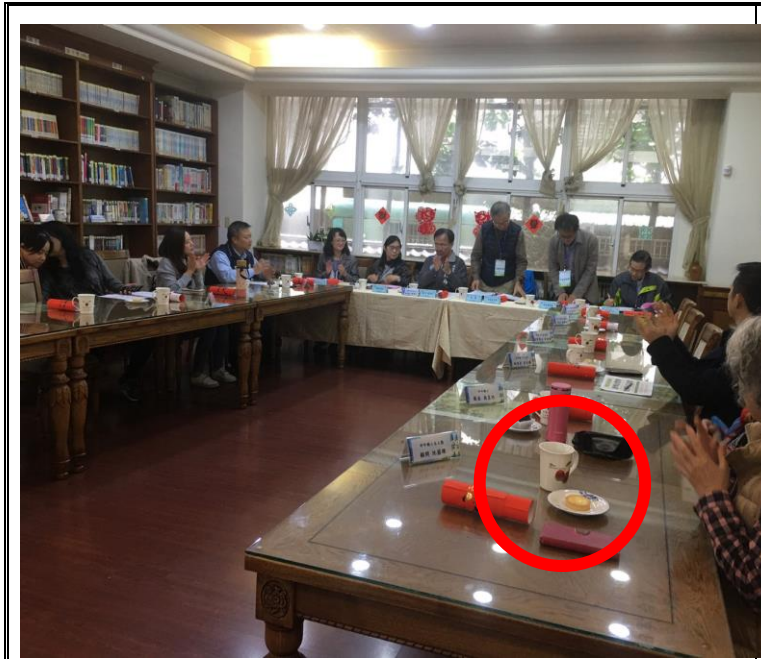
說明：外賓到校參訪均使用環保杯