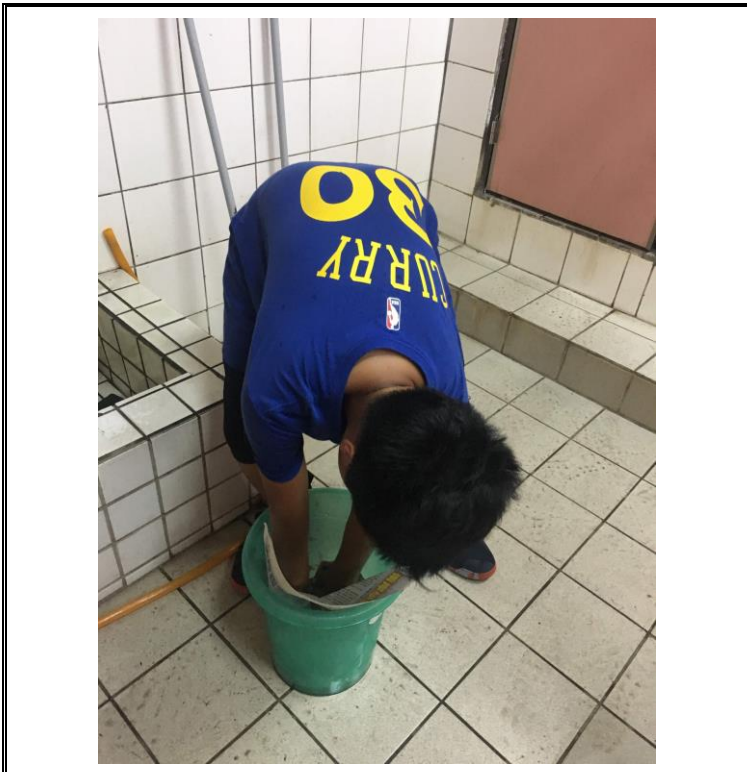
說明：校園減塑行動從廁所開始！