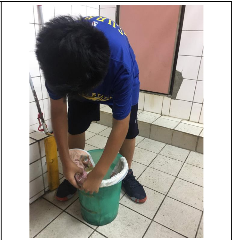
說明：利用讀報的報紙，取代原有的垃圾袋