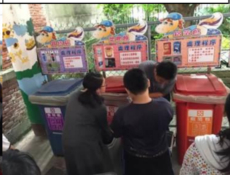
說明：每天分配不同的年級進行回收