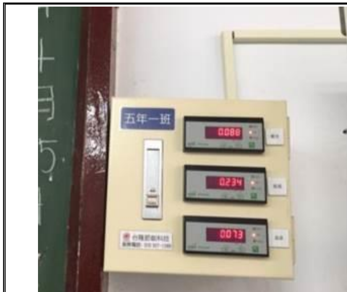
說明：五年級教室安裝數位電表

制訂節水管理措施，加裝省水龍頭、二段式沖水系統、數位電表、廁所紅外線感應電燈、太陽能與風力發電、智慧雨撲滿