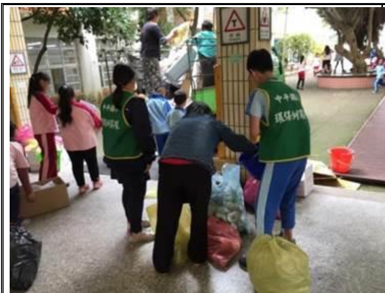
說明：兩週一次資源回收車到校