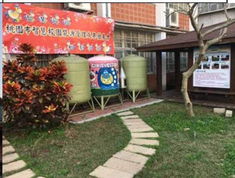
說明：智慧雨撲滿(節水)