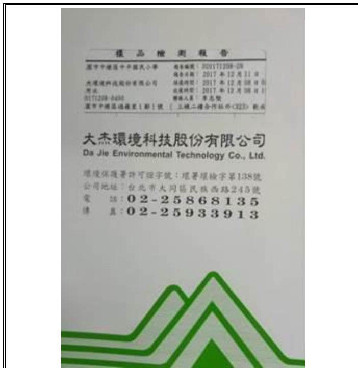
說明：大杰環境科技公司檢驗