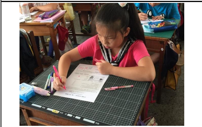
說明：宣導後，學生書寫學習單