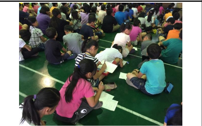
說明：學生聽演講過程中，認真寫筆記