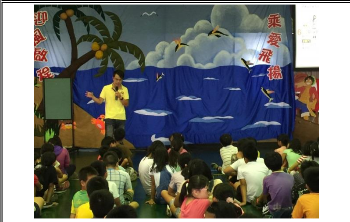
說明：葉藥師透過生活化的案例為學生介紹如何正確使用藥物