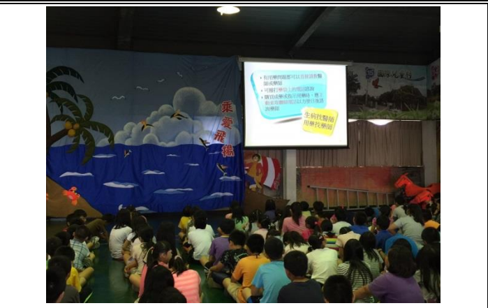
說明：學生們個個認真聆聽