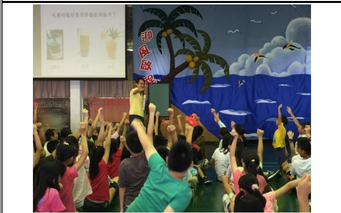
說明：氣氛熱絡的有獎徵答活動