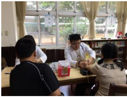
教師健康檢查服務