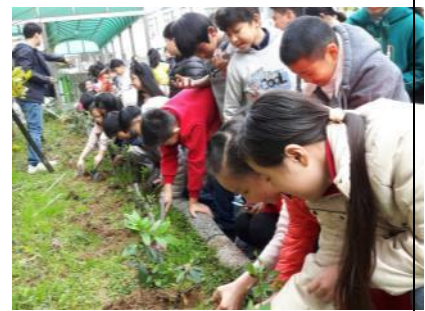
五年級校園植樹活動