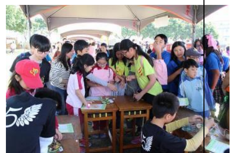
校慶園遊會—闖關活動