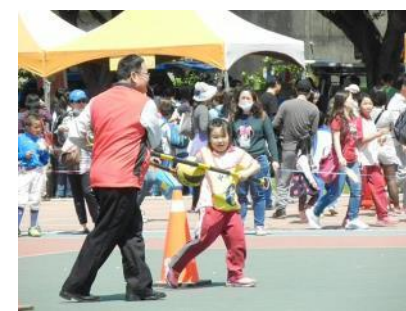
校慶園遊會—趣味競賽