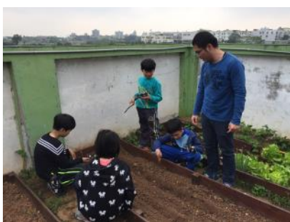
三年級祝福向日葵種植活動