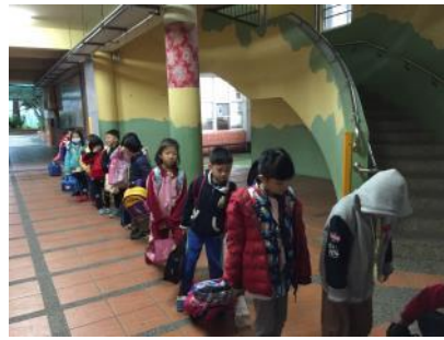
學生書包檢測活動