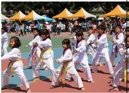
多元社團—跆拳道社