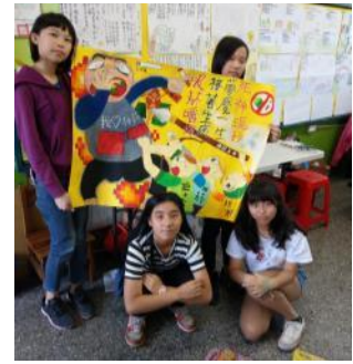
參與反菸拒檳創意海報競賽