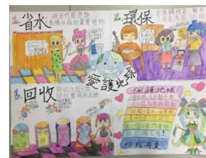
環保議題學生作品