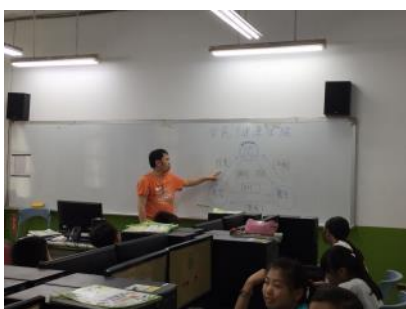
多元化教學—資訊融入