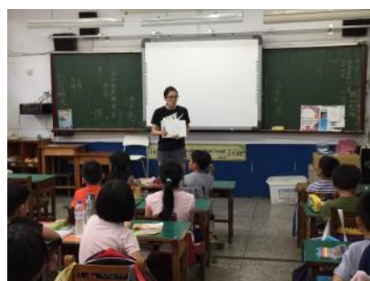
多元化教學—繪畫創作