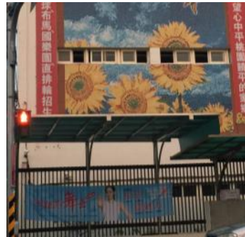
校門口外掛上拒菸宣導布條