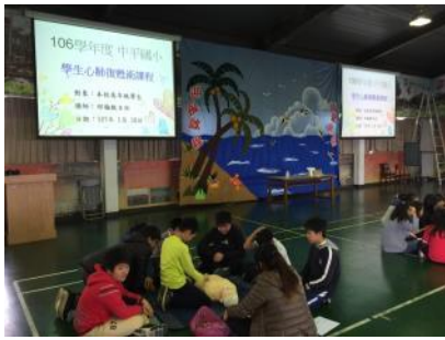
學生 CPR 課程