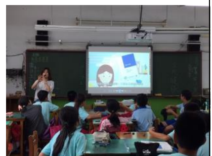
多元化教學—多媒體欣賞