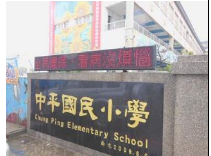
全民健保跑馬燈宣導