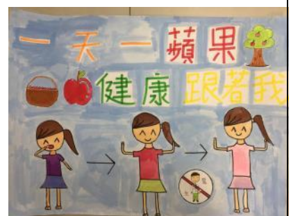
健康飲食學生作品