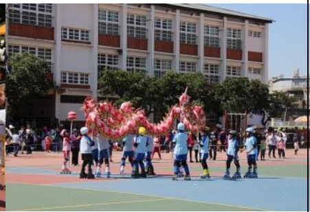
多元社團—直排輪社