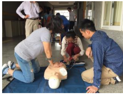
教師 CPR 暨 AED 研習