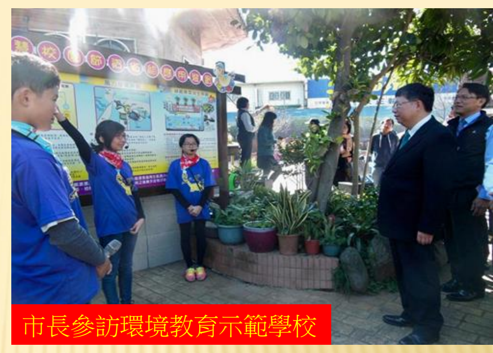
市長參訪環境教育示範學校